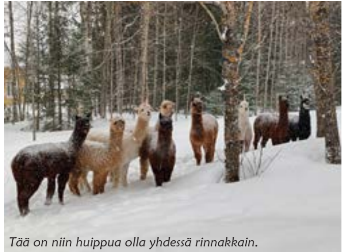
Tää on niin huippua olla yhdessä rinnakkain.

Retkille menemme yleensä kimppekyydeillä ja niihin pitää etukäteen ilmoittautua. Tuvalle voi vain tulla, kun aikataulu sopii itselle. Joskus on käynyt niin, ettei ketään tullut, jolloin vetäjät ovat odotelleet vähän yli kolmeen, jonka jäl-