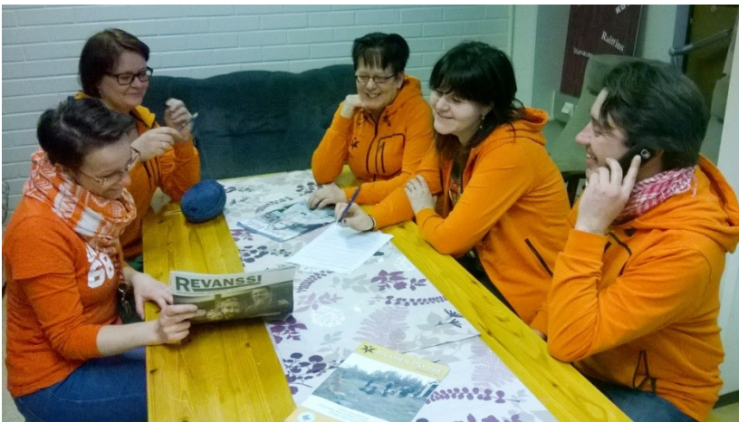
Raahen Psygyke ry:n työntekijät keväällä 2016

Kaikkien työntekijöiden työnkuvaan kuuluu jäsenistön, vapaaehtoisten ja työtoiminnassa olevien osallistaminen ja toimintamahdollisuuksien mahdollistaminen ja vahvistaminen, vapaaehtoistoiminnan tukeminen, mahdollisuuksien luominen, motivoiminen sekä vahvuuksien tunnistaminen ja vahvistaminen. Lisäksi kaikille kuuluu opiskelijoiden ohjaus ja ryhmien ja kurssien ohjaaminen yhdessä vertaisohjaajien kanssa sekä yhdistystoiminnan suunnittelu ja ylläpitäminen yhdessä vapaaehtoisten kanssa.