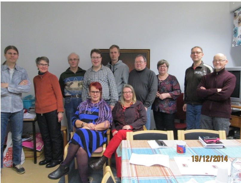
Hallituksen jäseniä 2014-2015